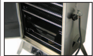
ALLUMAGE ÉLECTRONIQUE pour un démarrage rapide, dès que vous êtes prêts.

Imaginez ce que vous pourrez cuisiner dans nouveau fumoir Série Signature de Castings. Avec 1 033 pouces carrés de su cuisson, une puissance de 17 500 BTU et d'aération ajustables à votre service, vous vos invités à coup sûr ! Les panneaux de double paroi contribuent à retenir la chaleur trouvez un indicateur de température com plus pratique sous la plaque de fonte sign Signature. Vous apprécierez également la copeaux en acier moulé, le contrôle élec ainsi que la prise confortable de la poig verrouillage. Un tout nouveau fum construction solide et d'une facilité d'u désarmante.