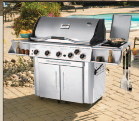
Série Signature | Grills à 5 brûleurs

Sous son couvercle en acier inoxydable distinguée, ce grill se démarque avec ses caractéristiques en ligne. D'une grande efficacité, il empêche la perte de chaleur : aucun autre grill ne se compare à ce système de cuisson. Avec ses grilles de cuisson de 20 pouces carrés et ses 230 pouces carrés de surface réchaud, il y a assez d'espace pour tout ce que vous voulez même plus ! Tout y est : plateaux à condiments, infra-rouge de rôtisserie de 20 000 BTU, rétro-éclairée et plus. Ajoutez-y une houssette en Série Signature et vous êtes prêt pour la saison.