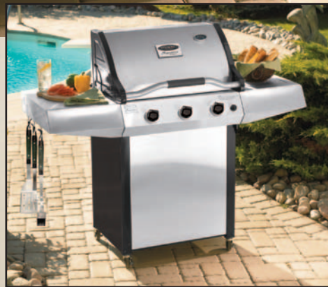
Série Signature | Grills à 3 brûleurs

Voilà ce qui arrive quand vous installez le fameux grill Signature dans un grill compact : la cuisson Signature dans un grill compact : la cuisson à 3 brûleurs est répartie sur 400 pouces carrés de fonte et 150 pouces carrés de grille-réchaud. Pour assurer une qualité de cuisson optimale, le couvercle est fabriqué dans un bâtit stylisé en fonte et en acier inoxydable pour conserver la chaleur à l'intérieur. Optez pour la qualité, l'efficacité et la fiabilité reconnues de Castings, mais encore plus important pour obtenir une cuisson parfaite et les résultats exquis que votre barbecue procurera. Avec ses tablettes pratiques, conçues pour offrir en option un brûleur latéral de 15 000 BTU, le couvercle fermé en inox, ses roulettes de qualité inoxydable. Beaucoup plus encore, la saison s'annonce de plus en plus. Disponible avec couvercle en acier inoxydable ou en porcelaine émaillée noir mica, édition limitée.