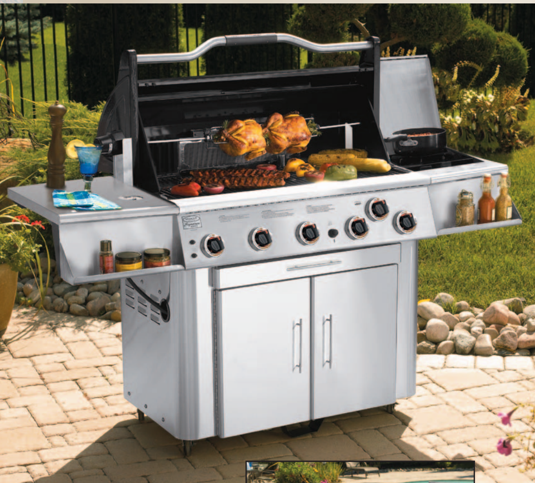
Modèle : VCS5007 à 5 brûleurs Grill à gaz en inox de 62 500 BTU