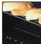
La GRILLE-RÉCHAUD permet de garder vos aliments croustillants.