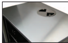
BUSES D'AÉRATION AJUSTABLES pour un fumage de grande précision.