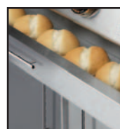
TIROIR RÉCHAUD : garder les pains au chaud et servir au moment opportun.