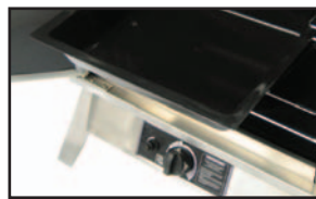
Boîte à copeaux en ACIER MOULÉ avec tablette amovible facilitant le retrait des copeaux.