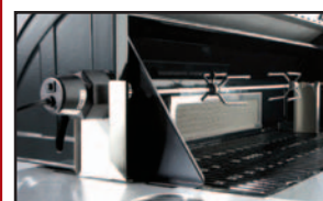
Le BRÛLEUR et L'ENSEMBLE DE RÔTISSERIE assurent une cuisson lente et constante pour de grosses pièces de viande ou des poulets entiers.

Disponible avec couvercle en acier inoxydable ou édition limitée de couvercles en porcelaine blanche, noir mica, vert mica et bronze.