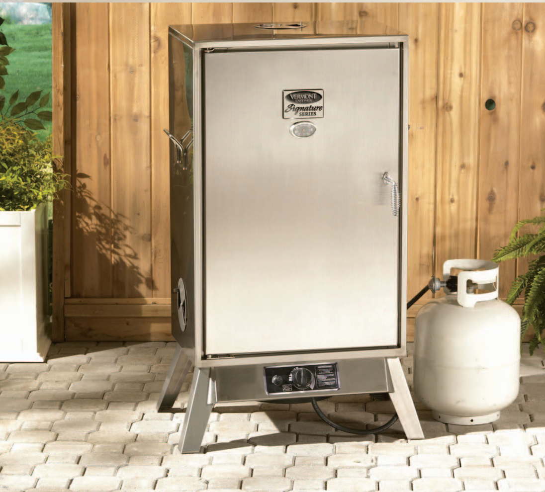
Modèle : VC3624GS Fumoir en acier inoxydable de 17 500 BTU