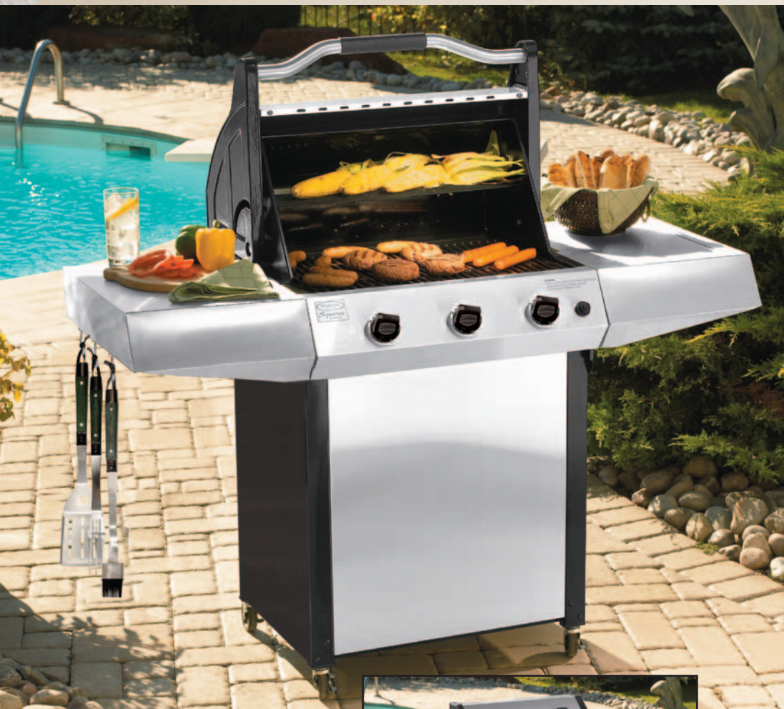
Modèle : VCS3007 VCS3517 à 3 brûleurs Grill à gaz en inox de 37 500 BTU