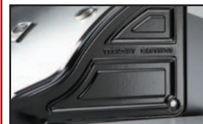
Les panneaux à double paroi et les CÔTÉS DE FONTE sur le couvercle retiennent la chaleur pour une cuisson optimale ce qui permet de mieux saisir les aliments.

Voilà ce qui arrive quand vous installez le fameux grill Signature dans un grill compact : la cuisson Signature dans un grill compact : la cuisson à 3 brûleurs est répartie sur 400 pouces carrés de fonte et 150 pouces carrés de grille-réchaud. Pour assurer une qualité de cuisson optimale, le couvercle est fabriqué dans un bâtit stylisé en fonte et en acier inoxydable pour conserver la chaleur à l'intérieur. Optez pour la qualité, l'efficacité et la fiabilité reconnues de Castings, mais encore plus important pour obtenir une cuisson parfaite et les résultats exquis que votre barbecue procurera. Avec ses tablettes pratiques, conçues pour offrir en option un brûleur latéral de 15 000 BTU, le couvercle fermé en inox, ses roulettes de qualité inoxydable. Beaucoup plus encore, la saison s'annonce de plus en plus. Disponible avec couvercle en acier inoxydable ou en porcelaine émaillée noir mica, édition limitée.