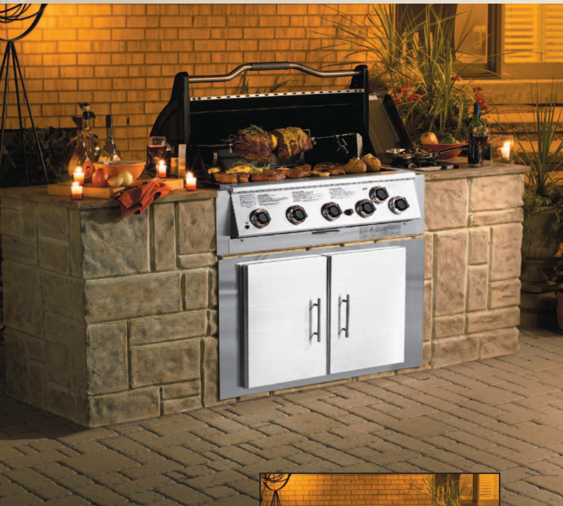
Modèle : VSC5007BI à 5 brûleurs Grill à gaz en inox de 62 500 BTU (îlot non inclus)