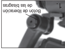
1. Botón de liberación de las bisagras